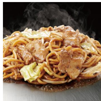
秘伝70年焼そば 豚入り 1,100円