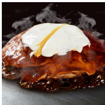
発祥モダン焼 豚入り 1,200円