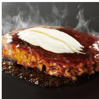
元祖お好み焼 豚玉 1,100円